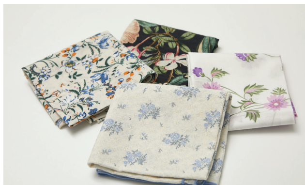
지구를 지키는 다용도 손수건