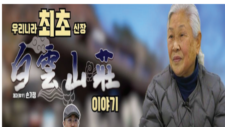
강북 마을탐험가 시리즈 (1920×1080 HD)