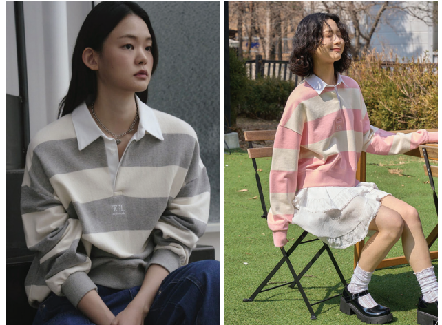
더그린랩 스트라이프 럭비 카라 맨투맨