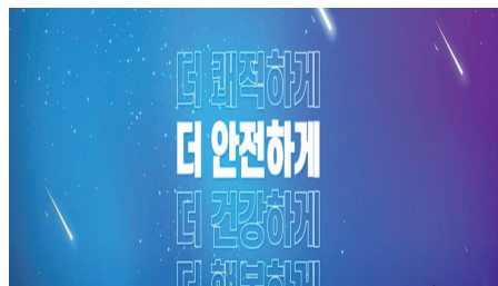
성북구 주민자치회 홍보영상 (1920×1080 HD)