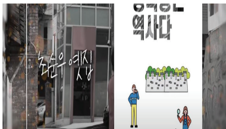
성북동 명소 소개영상 (1920×1080 HD)