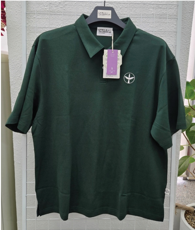
더그린랩 카라 피케 반팔티