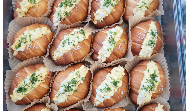
소금빵 샌드위치 2개 세트