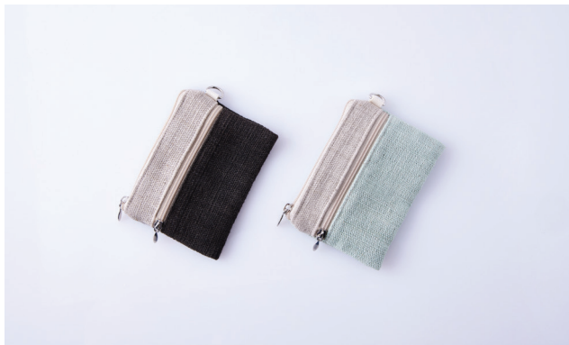
공정무역 카드지갑 (명함지갑)