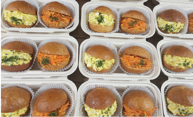
모닝빵 샌드위치 2개 세트